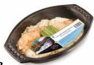
1632 Lax med Västerbottensost och potatisgratäng ca 420 gr.

Marinerad och varmrökt regnbågslox med västerbottensost, sockerärter, potatisgratäng, broccoli och chili/örtsås.