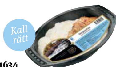
1634 Skepparlax med potatissallad ca 400 gr.

Lättrökt regnbågslox med tre sorters kryddor och krämig potatissallad. Serveras och ätes kall.