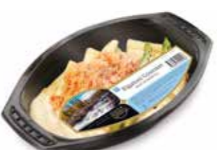
1667 Rigatoni gourmet ca 420 gr.

Rigatoni med varmrökt regnbågslox, sparris och italiensk ostsås.