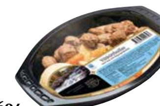
1694 Viltköttbullar med mos och lingongräddsås ca 400 gr.

Viltköttbullar med potatismos och lingon- gräddsås. Serveras med en grönsaksblandning på kålrötter, selleri och palsternacka.