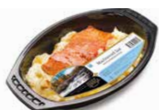
1621 Marinerad lax ca 450 gr.

Marinerad regnbågslox med potatisgratäng smaksatt med lök och örter.