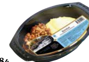
1684 Renskav med gräddsås och potatismos ca 420 gr.

Renskav med gräddsås, potatismos och lingonsylt.