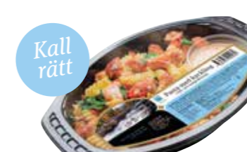
1689 Pasta med kyckling ca 400 gr.

Pasta med kyckling och chili- och mango- dressing. Serveras och ätes kall.