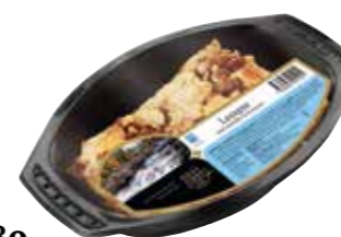
1680 Lasagne med lammfärs och fetaost ca 400 gr.

Gratinerad lasagne med lammfärs, fetaost, tomater, lök och grädde.