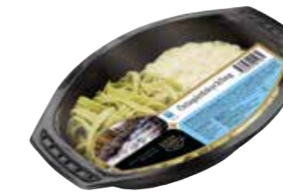
1682 Örtagårdskykling ca 400 gr.

Tagliatelle med krämig sås av kyckling, crème fraiche, grädde och örter.