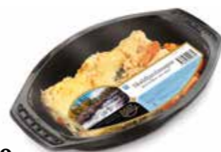
1630 Skaldjurslasagne ca 420 gr.

Ostgratinerad lasagne varvad med skaldjur, bladspenat, krämig hummersås och morötter.