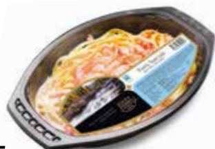
1615 Pasta speciale ca 400 gr.

Bandspagetti med räkor, kräftstjärtar, varm- rökt regnbågslox och chili/örtsås.