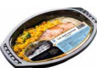
1695 Lax med couscous ca 400 gr.