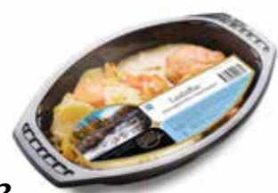
1692 Laxbiffar med ugnstekta rotgrönsaker ca 400 gr.

Biffar av lax och sej med en krämig sås och ugnstekta rotgrönsaker.