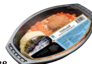
1688 Viltfärsbiff med mos och trippelpepparsås ca 400 gr.

Viltfärsbiff med potatismos och svart-, vit- och grönppepparsås.